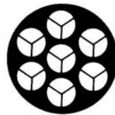
DA 18 HP 7 prismes, Ø18 mm